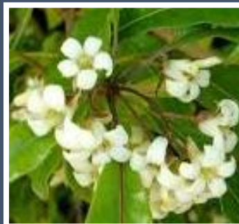
Fig. 2 – Flor de oliveira