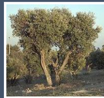
Fig. 1 – Oliveira

Trabalho realizado pelos alunos do 3.º 1 da EB1/JI Brandoa