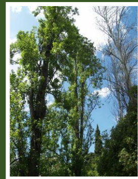
Fig. 1 – Choupo

Trabalho realizado pelos alunos do 3.º 3 da EB1/JI Brandoa