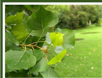
Fig 2. – Folha do choupo