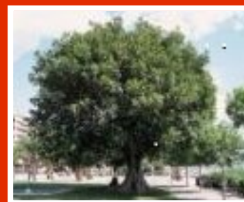
Fig. 1 – Figueira da Austrália

Trabalho realizado pelos alunos do 4.º 1 da EB1/JI Brandoa