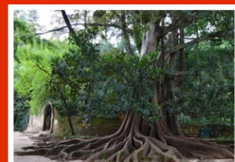
Fig. 3- Figueira da Austrália existente na Quinta das Lágrimas em Coimbra.