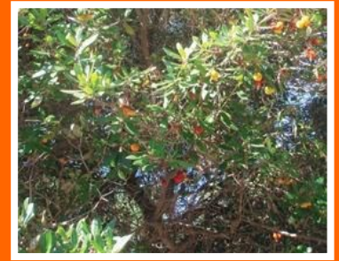
Fig. 1 – Medronheiro

Trabalho realizado pelos alunos do 3.º 2 da EB1/JI Brandoa