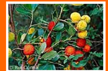
Fig. 3 – Medronho