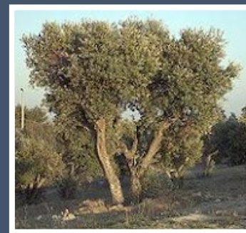
Fig. 1 – Oliveira

Trabalho realizado pelos alunos do 3.º 1 da EB1/JI Brandoa