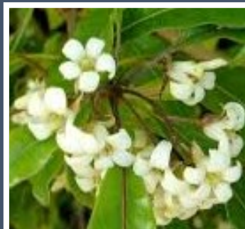
Fig. 2 – Flor de oliveira