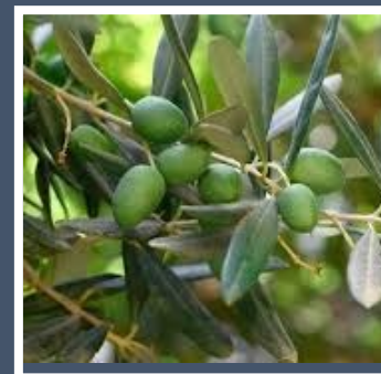
Fig. 4 – Azeitona (fruto da oliveira)