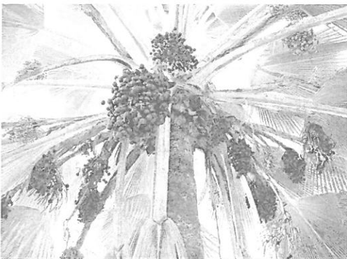
Imagem 2 – Fruto da palmeira

Manutenção: Exige pouca manutenção, que consiste na remoção das folhas velhas e secas e fertilizações regulares durante as estações quentes.